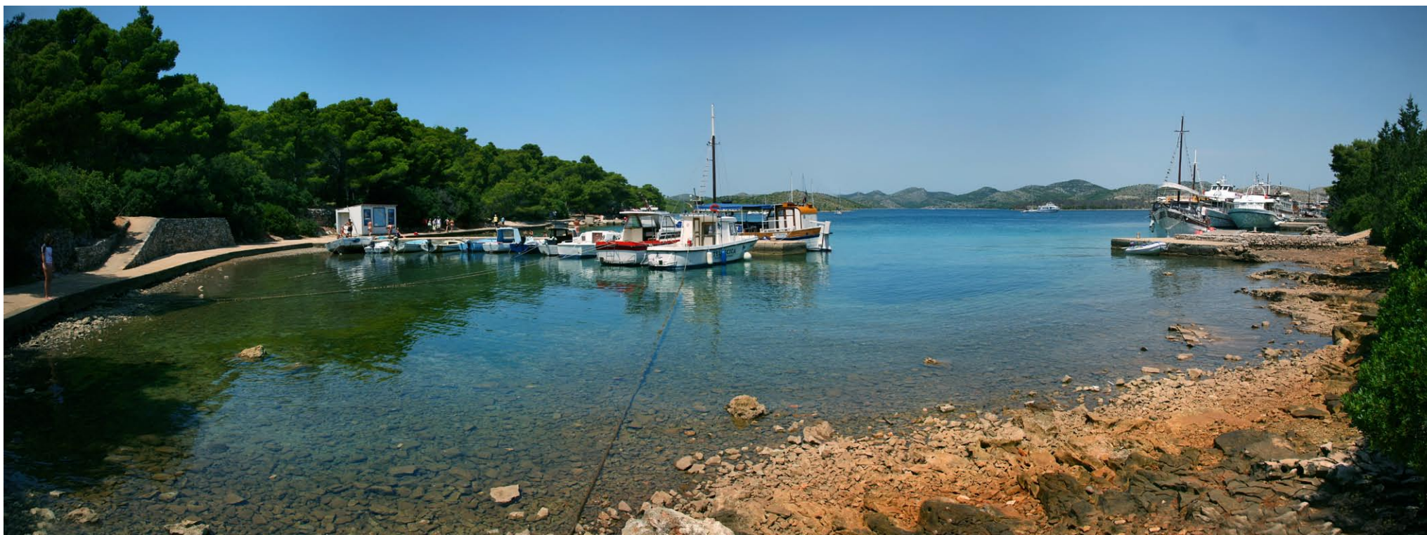
Port na Dugim Otoku

dobrze zapoznać się z ich ofertą, ceny jak i oferowane atrakcje mogą się sporo różnić od siebie. Najtańsze rejsy są z Zadaru i okolicznych wysp. Najlepiej płynąć z południa, gdyż po drodze przepływa się przez cały park.